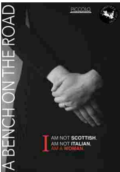
A Bench on the Road

Vite in viaggio alla ricerca di casa al Piccolo Teatro Studio Melato.